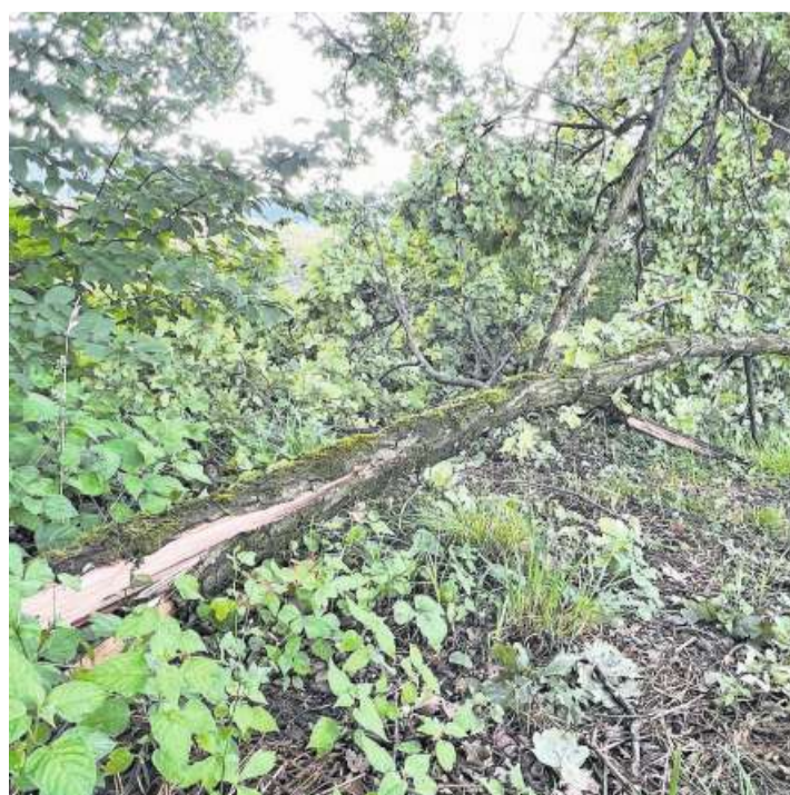
Der vergangene Woche abgebrochene Ast einer Eiche auf der Luzerner Allmend.

Es kam in den vergangenen Jahren auch schon vor, dass auf der Allmend gleich eine ganze Eiche umgestürzt ist. Gemäss Bächle weisen diese Bäume teils ein hohes Alter auf: «Deswegen wird das Wurzelwerk teilweise nicht mehr in bester Ordnung sein.» Wenn dann Sturmwinde auf die grossen Baumkronen treffen, könne es zu einem Sturz kommen.